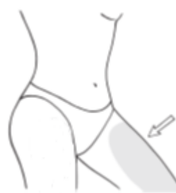
Binnenkant van uw bovenbenen