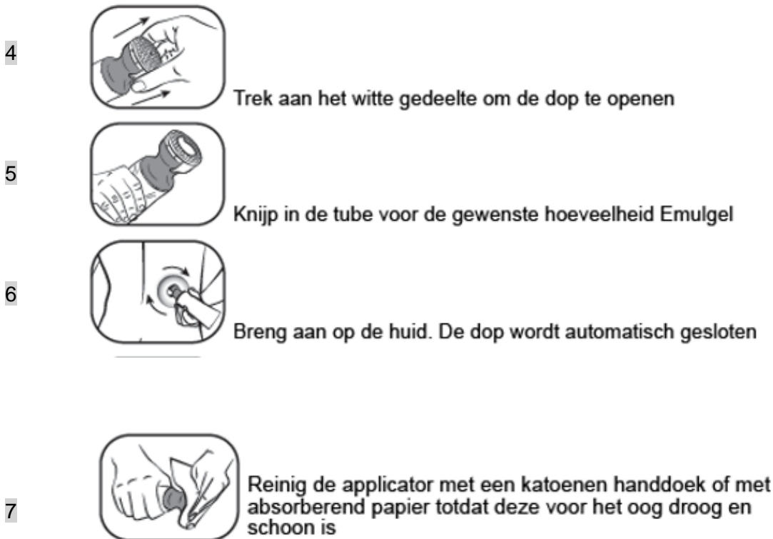
Figuur 2: Doseer- en smeerdop instructie stap 4 t/m 7

Gebruik de applicator niet opnieuw voor een andere tube. Volg bij het weggooien van de tube de in uw land geldende regels voor het weggooien van medicijnen.