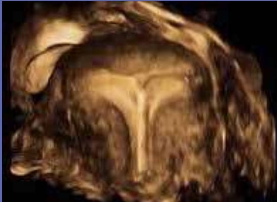
Figuur 2: Mirena – transversaal vlak (3D-Imaging)