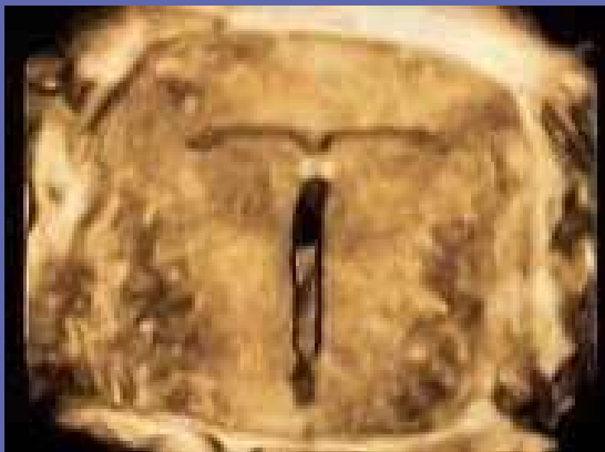
Figuur 4: Kyleena – transversaal vlak (3D-Imaging)