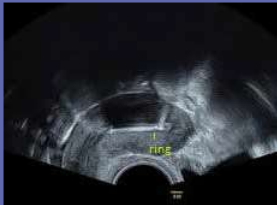
Figuur 5: Kyleena – sagittaal vlak (2D-Imaging)