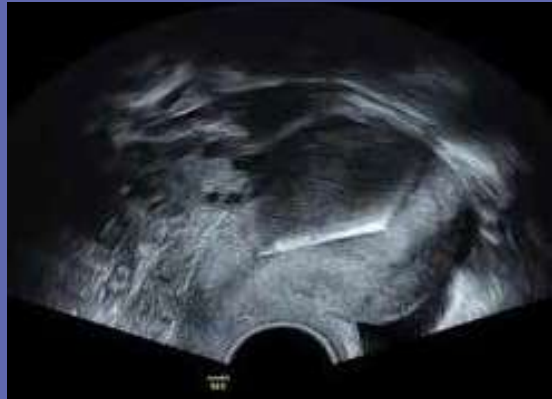
Figuur 3: Mirena – sagittaal vlak (2D-Imaging)