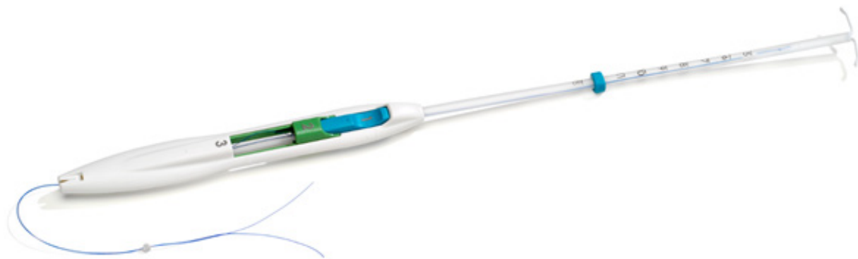
Figuur 3: Inserter voor Levosert