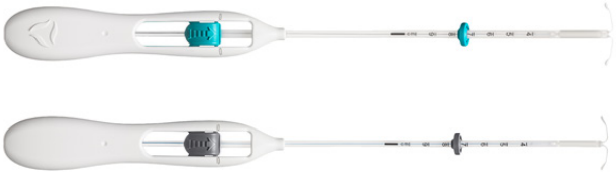
Figuur 2: Inserter voor Mirena (boven) en Kyleena (onder)

In Figuur 2 zijn de inserters van Mirena & Kyleena afgebeeld; in Figuur 3 is de inserter van Levosert afgebeeld. De belangrijkste verschillen in insertietechniek staan in tabel 3.