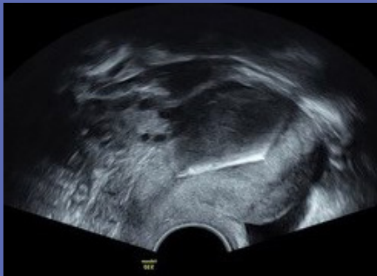
Figuur 3: Mirena – sagittaal vlak (2D-Imaging)