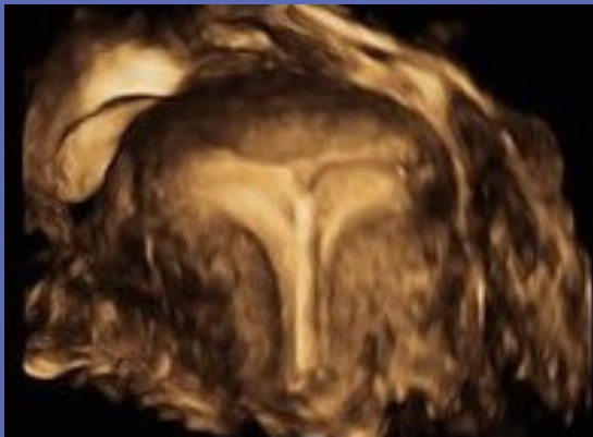
Figuur 2: Mirena – transversaal vlak (3D-Imaging)