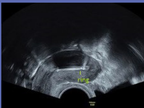
Figuur 7: Kyleena – sagittaal vlak (2D-Imaging)