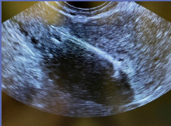
Figuur 5: Levosert – sagittaal vlak (2D-Imaging)